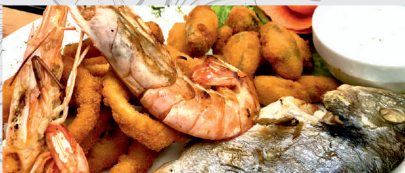
57. Platou Mediteranean