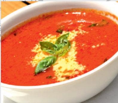
25. Supă cremă de roșii