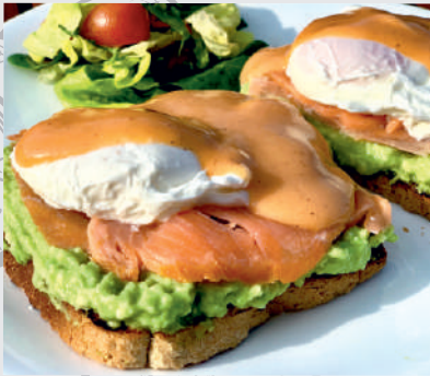
15. Ouă Poșate cu Somon și Avocado