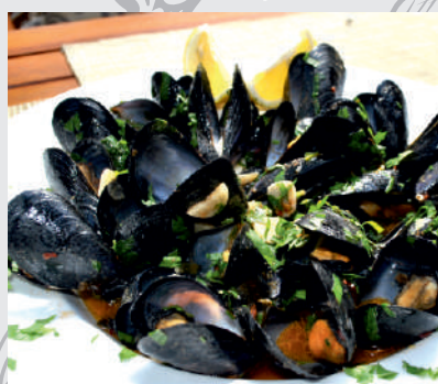
61. Scoici în sos Provençal