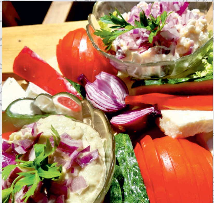
35. Gustare Dobrogeană