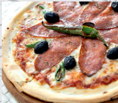
137. Pizza Piccante