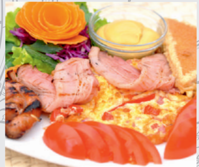
19. Mic dejun RUSTIC