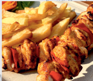
76. Frigărui din Piept de Pui