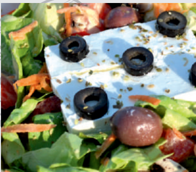
165. Salată Santorini