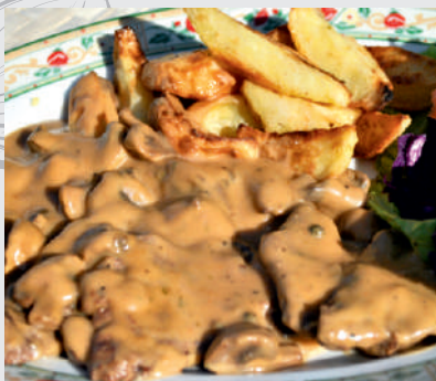
99. Filetto al Pepe Verde