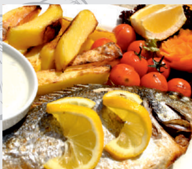
54. Dorada la cuptor