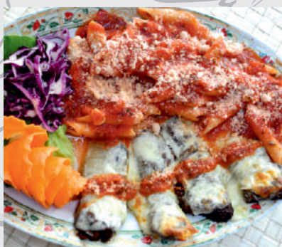
101. Vitello Motor