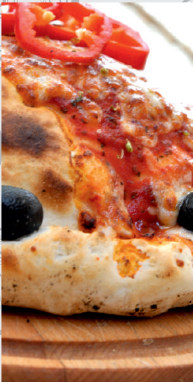
135. Pizza Calzone