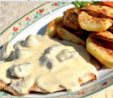
21. Polo Calabrese