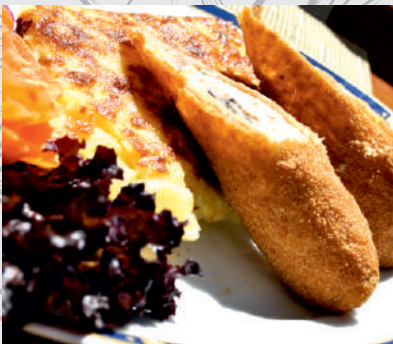
79. Ruladă de Pui Pane alla Parma