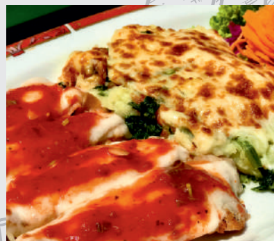
93. Scalopine Valdostana