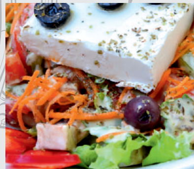
167. Salată Grecească