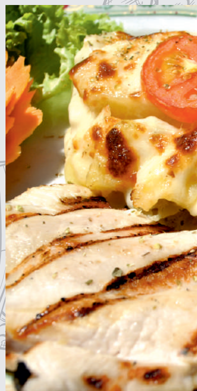
113. Piept curcan cu cartofi franțuzești