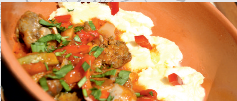
116. Tocăniță Tărănească