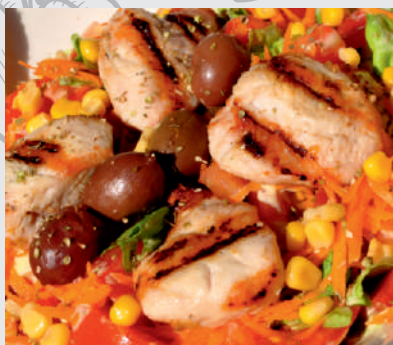
174. Salată Piept Curcan