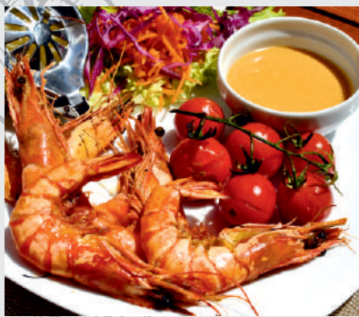
64. Gambas a la Plancha