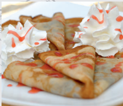
192. Clătite cu dulceață