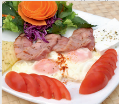
18. Mic dejun MOTOR