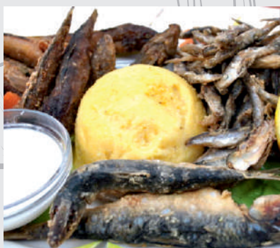
55. Platou Pescăresc