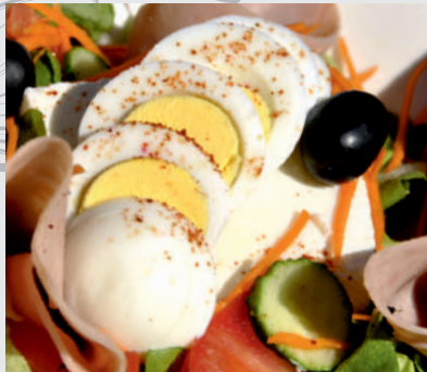
169. Salată Bulgărească