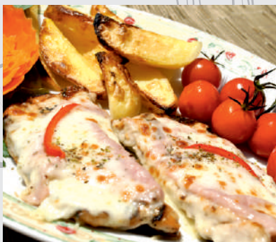
96. File Motor