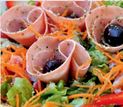
168. Salată MOTOR