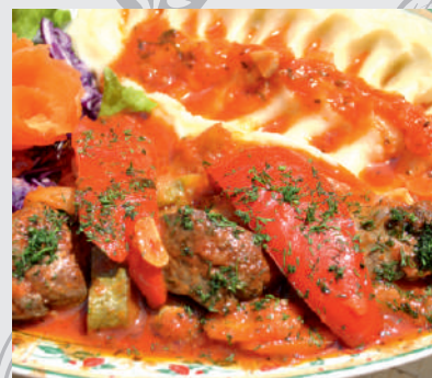
117. Tocăniță ficăței cu piure