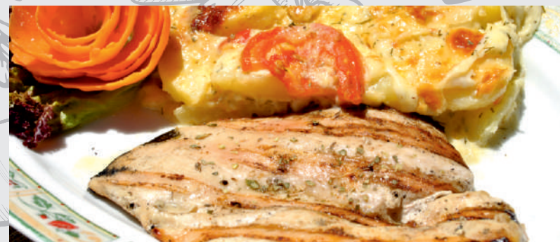
82. Piept Pui cu cartofi franțuzești