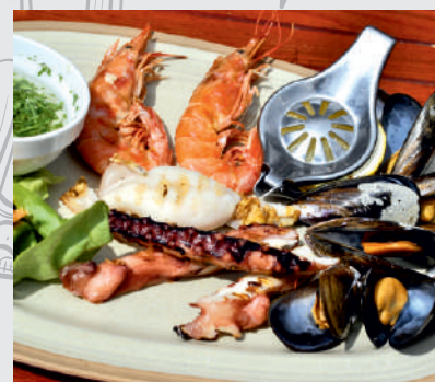
56. Platou fructe de mare