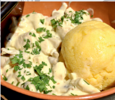
74. Ciulama de pui cu mămăliguță