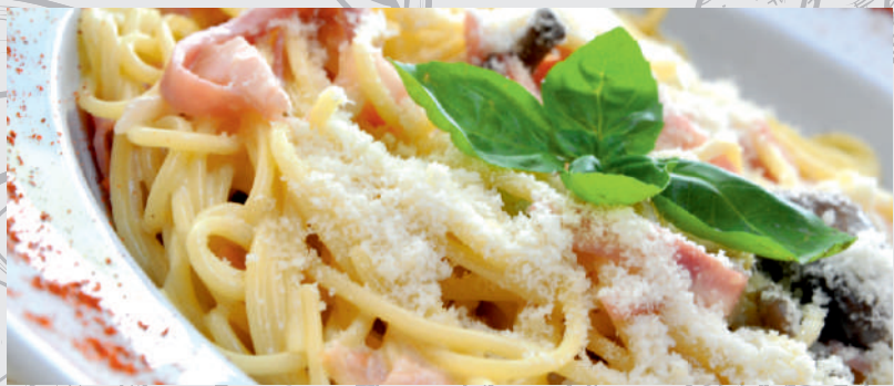
186. Spaghetti Carbonara