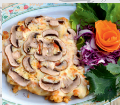
69. Șnițel Motor