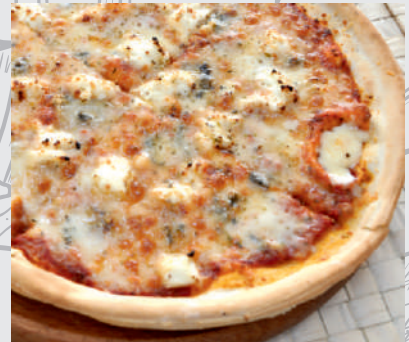
142. Pizza Quattro Formaggi