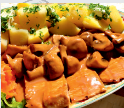
114. Curcan cu ciuperci