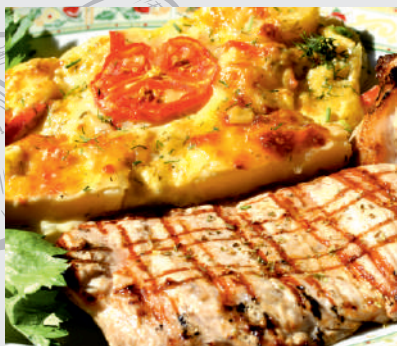
95. File de porc cu cartofi franțuzești