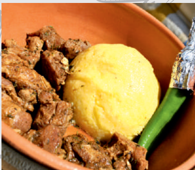
118. Pastramă Oaie cu mămăliguță