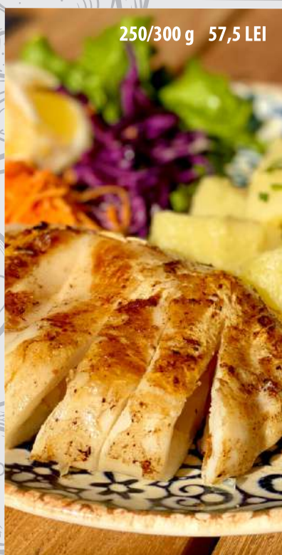
Calamar la plită cu cartofi natur