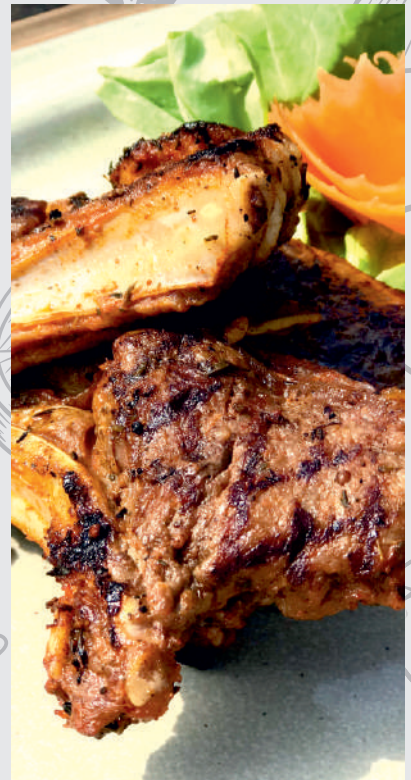
44. Cotețele de berbecuț la grătar