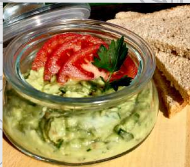
161. Spread Avocado