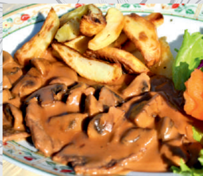
98. Filetto con Funghi