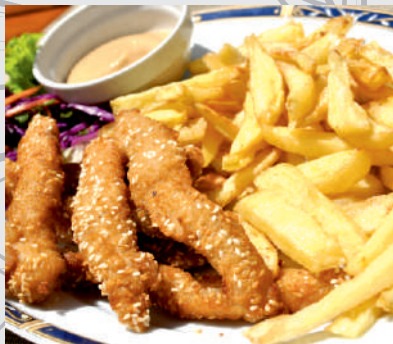
75. Gujoane de pui