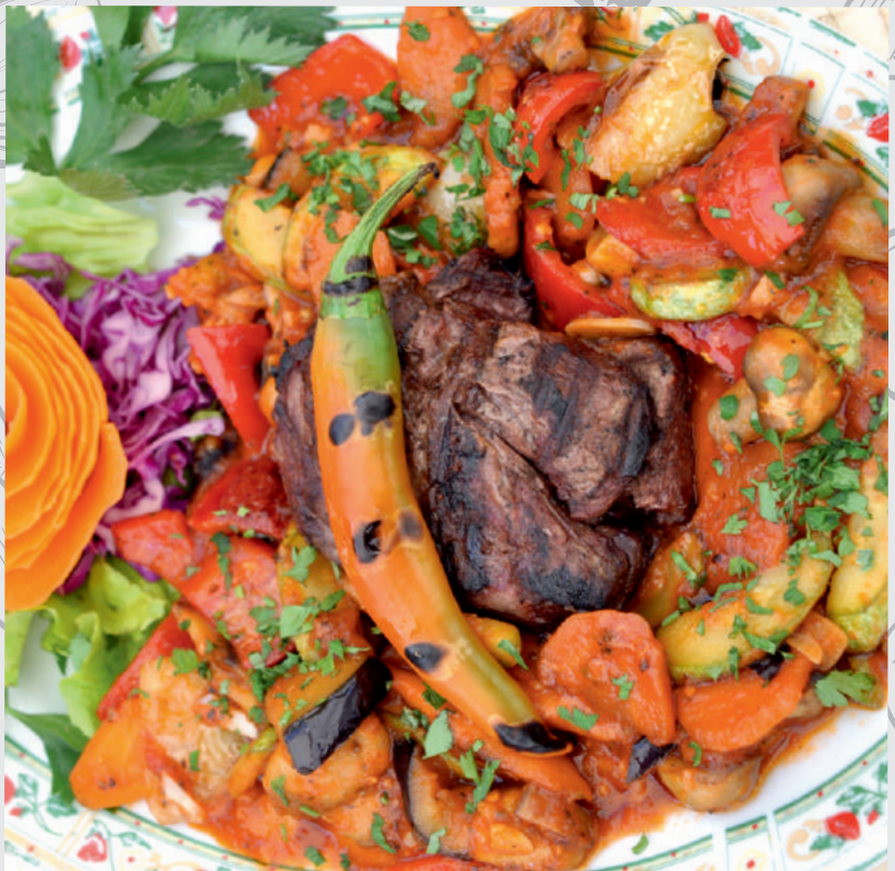
20. Mușchi Vită Provençal