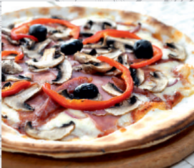
146. Pizza MOTOR