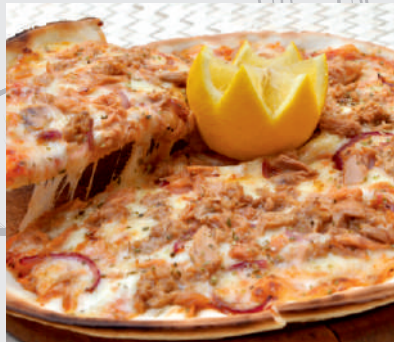
140. Pizza Tonno