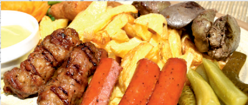
40. Platu „MOTOR”