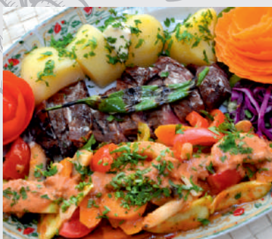
102. Vitello Campagnolo