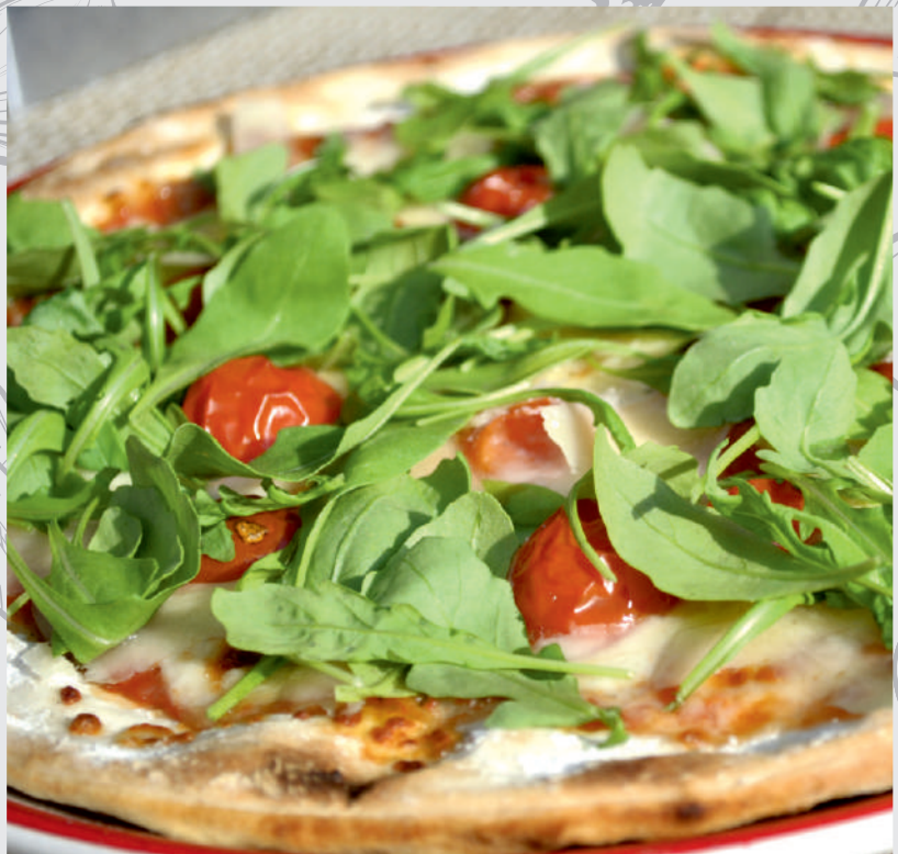
143. Pizza Romana