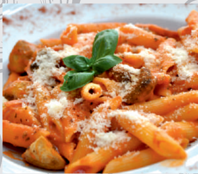
185. Penne Alla Due Salse