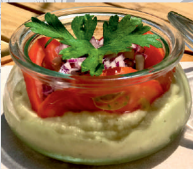
160. Salată de Vinete proaspete