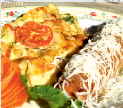
91. Rulada Primavera