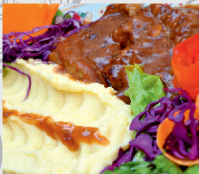
90. Ceafă de Porc în sos vânătoresc