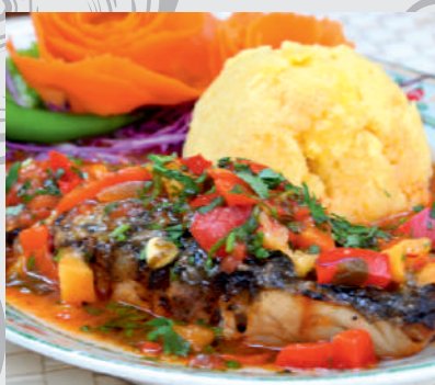
50. Saramură de Crap