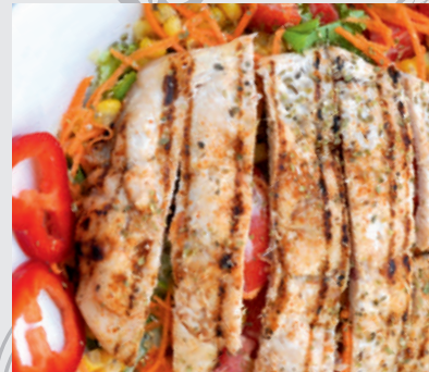
171. Salată de Pui