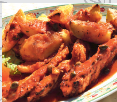
112. Curcan Rustico