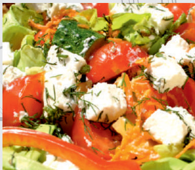
166. Salată Avocado