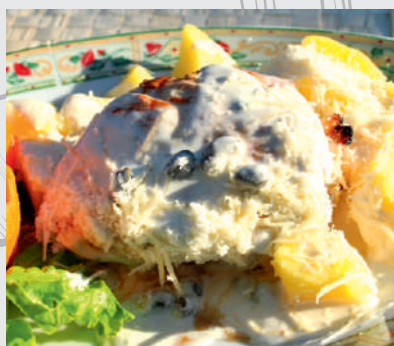
115. Curcan în sos alb