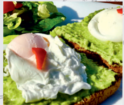
14. Ouă Poșate și Avocado