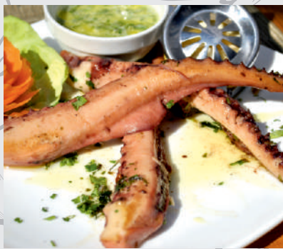
63. Tentacule caracatiță la tigaie/grătar