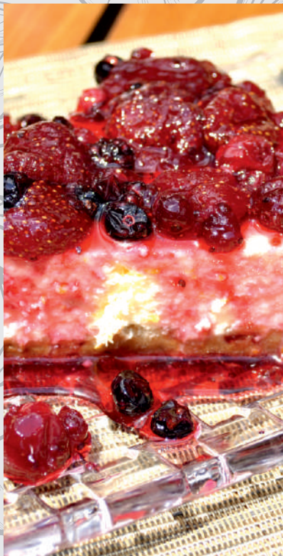
199. Tartă cu brânză și fructe de pădure