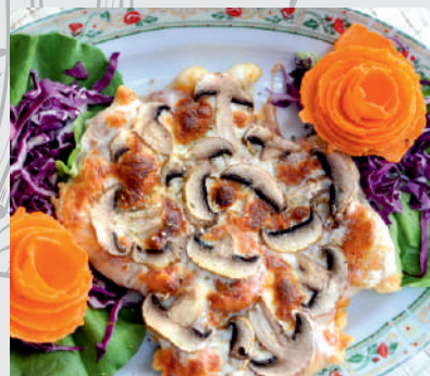
97. Vitello Parmegiano