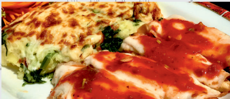
78. Pollo Valdostana