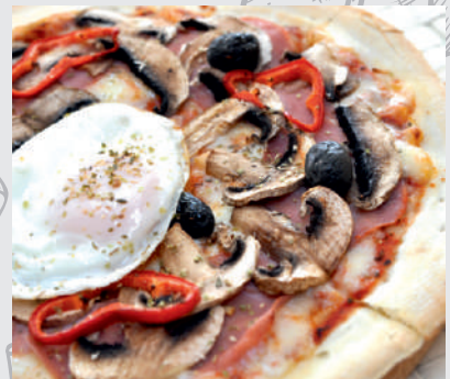
139. Pizza Sole Mio