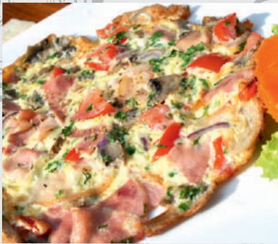
12. Omletă Tărănească