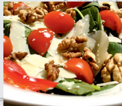
164. Salată Baby Spinach