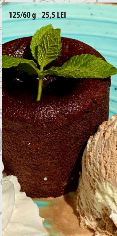
Lava cake cu înghețată