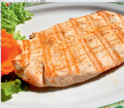
110. Piept curcan la grătar