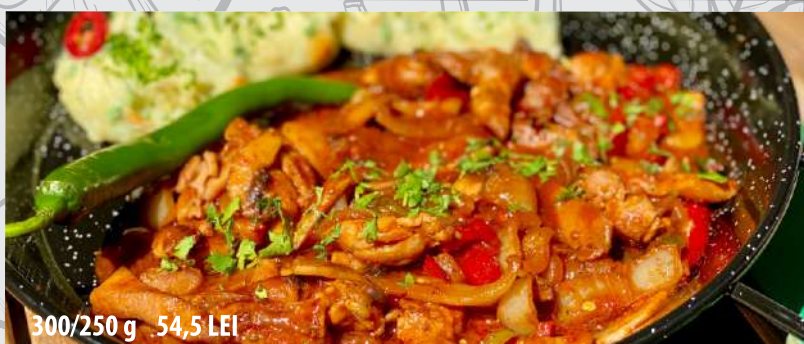
Tigaie picantă cu piure