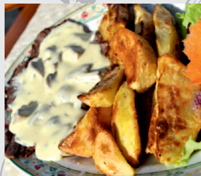
100. Vitello Gorgonzola