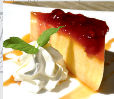
198. Cremă de zahăr ars cu dulceață