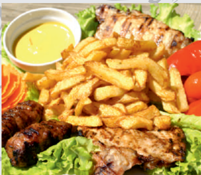
41. Mixed Grill