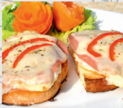
13. Ouă Benedicte