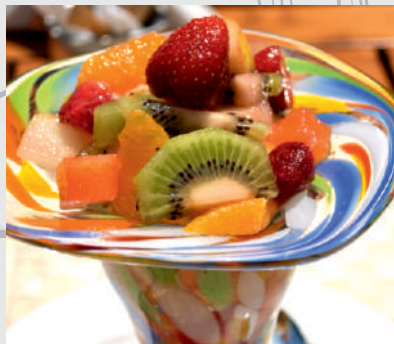
196. Salată de fructe proaspete