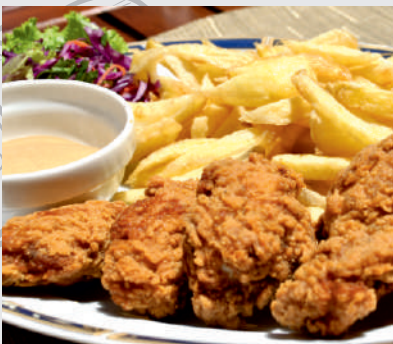
77. Aripioare de Pui Picante Pane