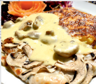
80. Pollo L'Estate