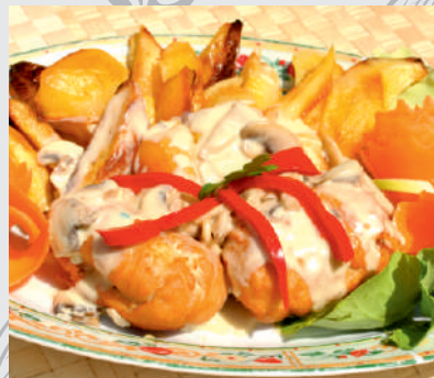
81. Greek Fantasy